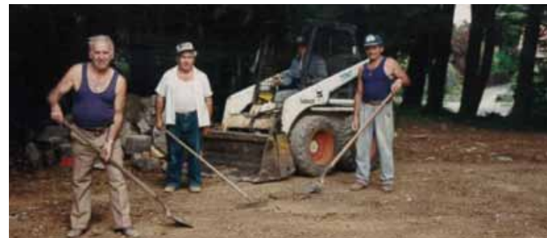
Men at Work

The Assisi Centre was able to obtain the beautiful Rosanna Road property, a 1920s Sisters of Mercy novitiate convent. The Commonwealth Government granted the Assisi Centre 120 residential aged care beds; the first 90 were opened in 1993.