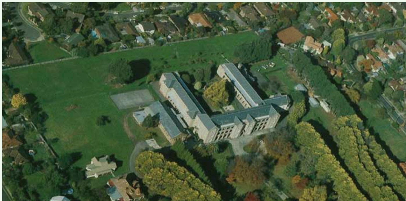
Spectacular Aerial View of the Convent