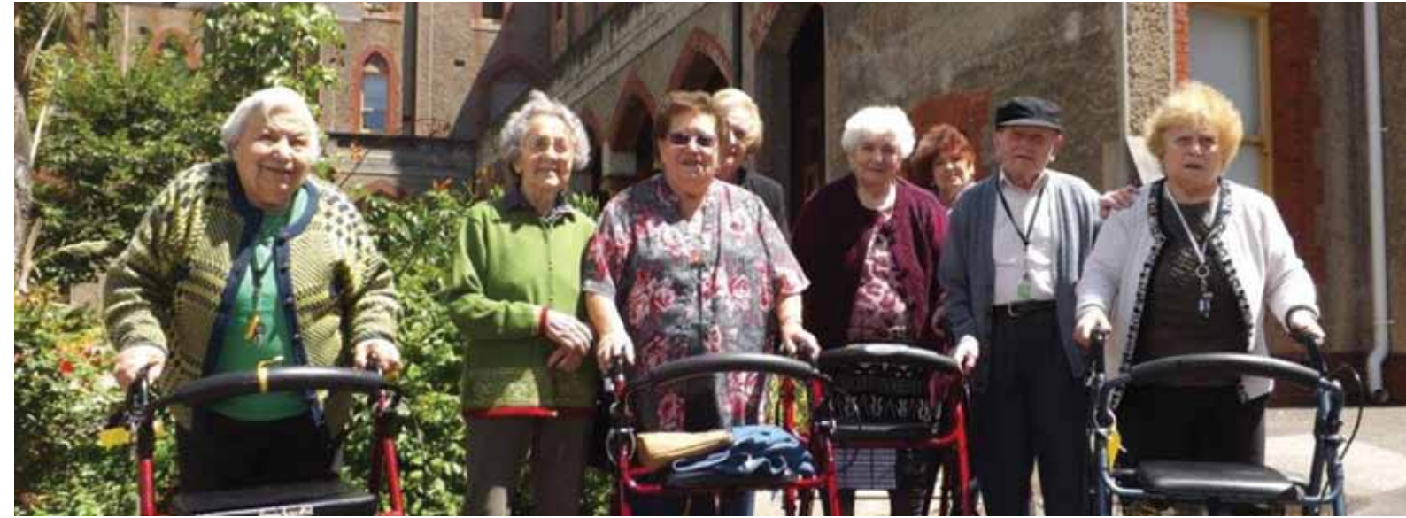
ABOVE - Residents at Abbotsford Convent