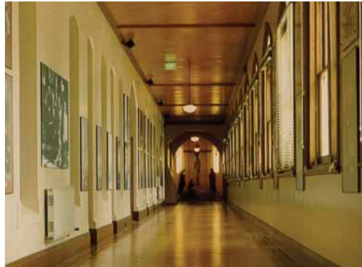
Gallery of Honour