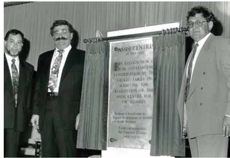
Assisi Centre Opening

The Assisi Centre was founded 25 years ago when the leaders of the Italian Community recognised a need to set up specialised aged care services to support Melbourne's fast growing elderly population. As a result, the Assisi Centre was established as a not-for-profit religious and charitable aged care organisation.