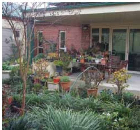
Assisi Centre Courtyard Garden